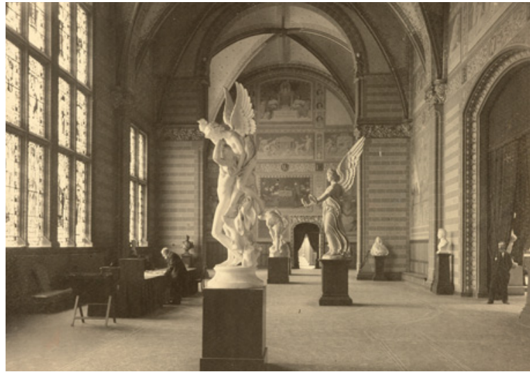
De Voorhal omstreeks 1909, volgens de intentie van architect Pierre Cuypers met gordijnen in de doorgangen, en de wanden en plafonds rijk beschilderd met taferelen en decoraties

De restauratie van de schilderingen en decoraties aan de binnenkant was in handen van Stichting Restauratie Atelier Limburg. In de ruggengraat van Voorhal, Eregalerij en Nachtwacht-zaal, en in de