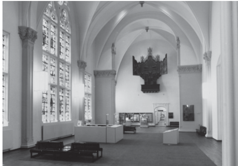
De Voorhal in 1988, compleet wit geschilderd